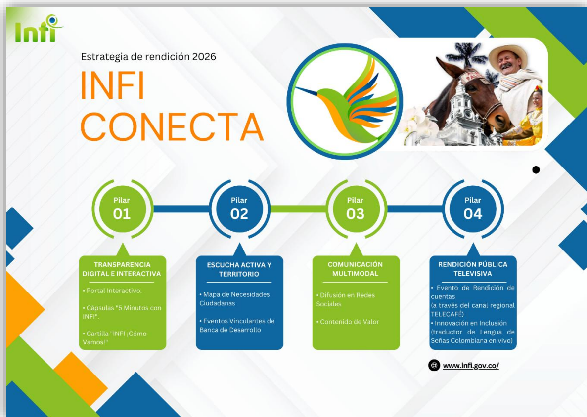
ILUSTRACIÓN 1. ESTRATEGIA DE RENDICIÓN 2026